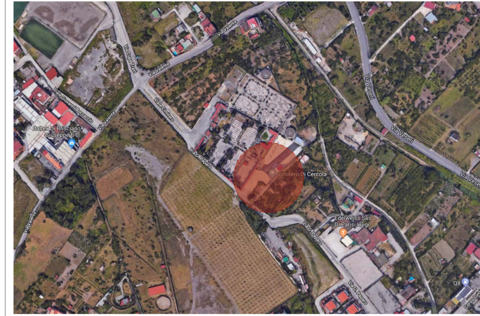
INDICAZIONE AEROFOTOGRAMMETRICA CENTRO COMUNALE DI RACCOLTA RIFIUTI